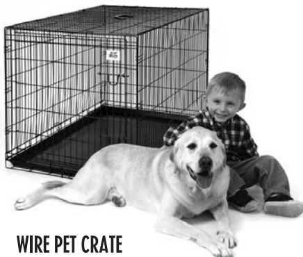
WIRE PET CRATE CASA DE LA MASCOTA

Observe estos otros productos de calidad de la línea Pet Lodge™