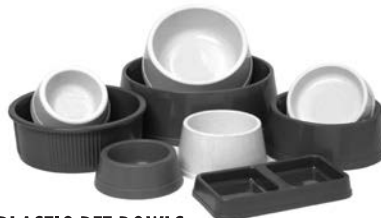
PLASTIC PET BOWLS VASIJAS PLÁSTICAS DE ALIMENTO