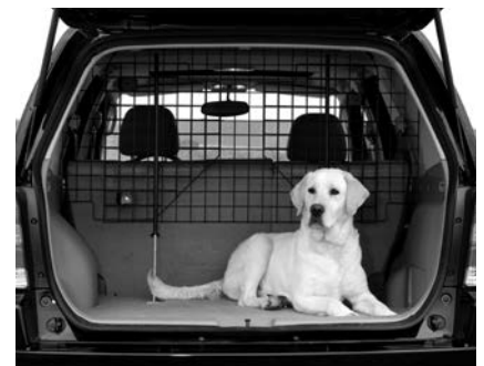
WIRE PET BARRIER MALLA DE SEPARACIÓN DE LA MASCOTA